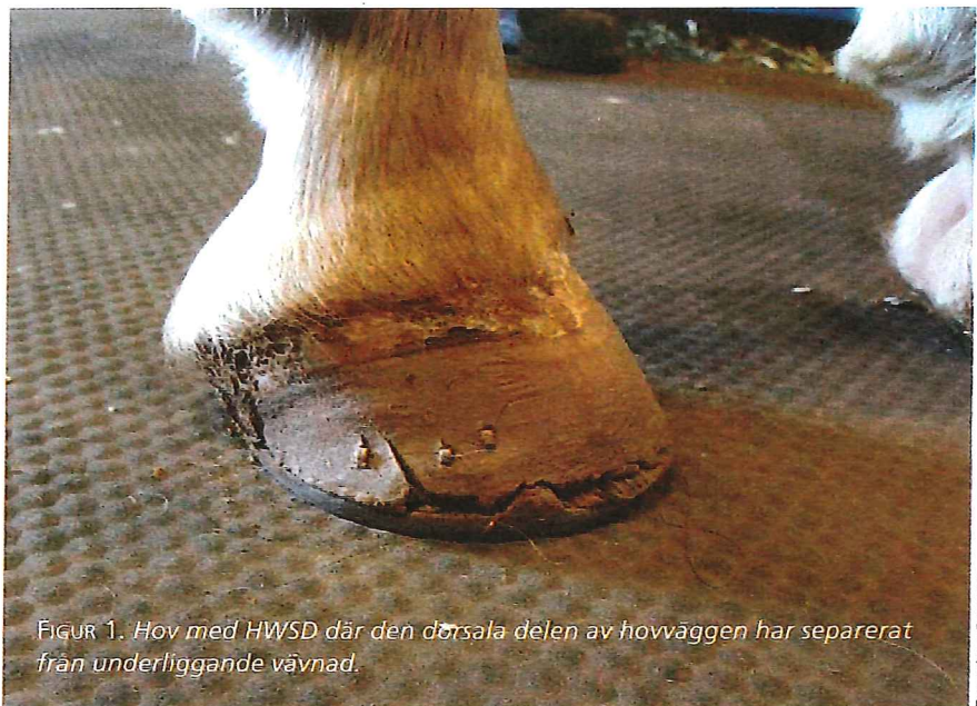
FIGUR 1. Hov med HWSD där den dorsala delen av hovväggen har separerat från underliggande vävnad.

HWSD är en sjukdom som innebär att dorsala hovväggen separerar utanför vita linjen på alla fyra hovarna. Lidandet är genetiskt och finns identifierat i rasen connemara, som är en vanligt förekommande ponnyras i Sverige. Sjukdomen kan yttra sig i varierande allvarlighetsgrad. I milda fall kan symtomen vara mycket subtila och kan missas, ibland kan hästen användas som ridhäst med särskild omvårdnad såsom täta verkningar och skoningar och i allvarligare fall blir hästen kroniskt halt.